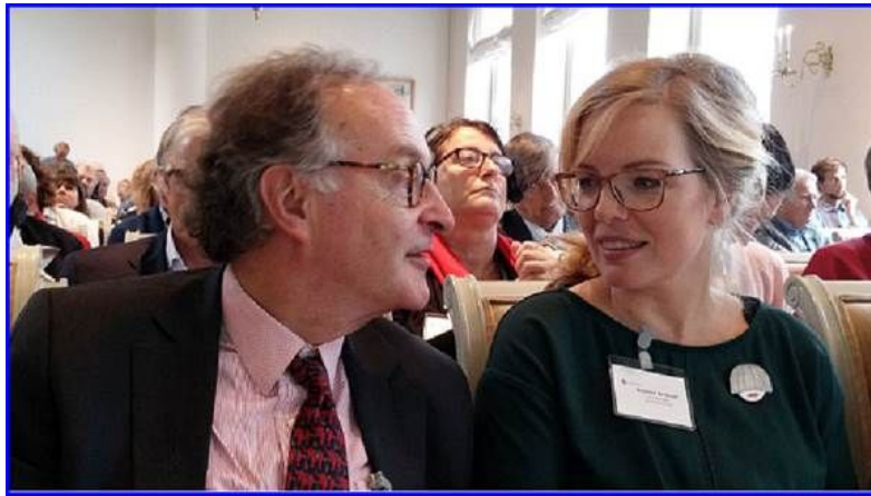
Klik op de foto voor een verslag van de Nationale Wetenschapsagenda